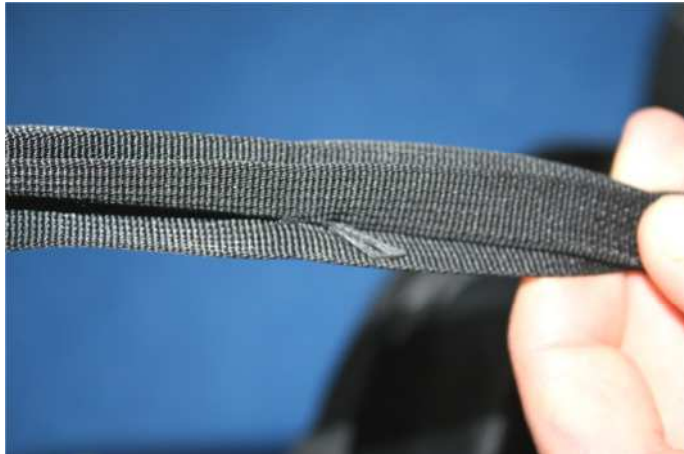
Abb.3 Beide Enden des verknoteten Wachsfadens zwischen den beiden Lagen des Bandes

PARATEC empfiehlt, die Verbindungsschlaufe nach Anbringung des POD durch zwei Wachsfadenstiche gemäß Bebilderung in Abb.3 und Abb.4. zu verschließen. Die Enden des Fadens sollen nach Anbringung des Chirurgenknoten zwischen den beiden Lagen des schwarzen Typ IV Bandes liegen. Ein Hängenbleiben des Ringes in einer ähnlichen Situation wird durch diese Maßnahme ausgeschlossen.