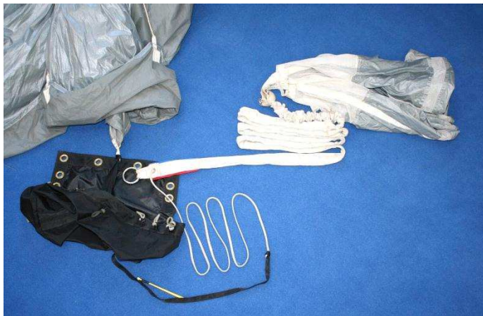
Abb.1 Drogue mit POD

Bei einem Tandemsprung kam es zum Einhaken des Ringes der Drogue-Verbindungsleine in die Verbindungsschleufe von POD und Hauptkappe (siehe Abb.1 und 2), verursacht durch Spiraldrehungen beim Kappenflug. Daraus resultierte eine Beeinträchtigung der Flug- und Flareigenschaften der Kappe.