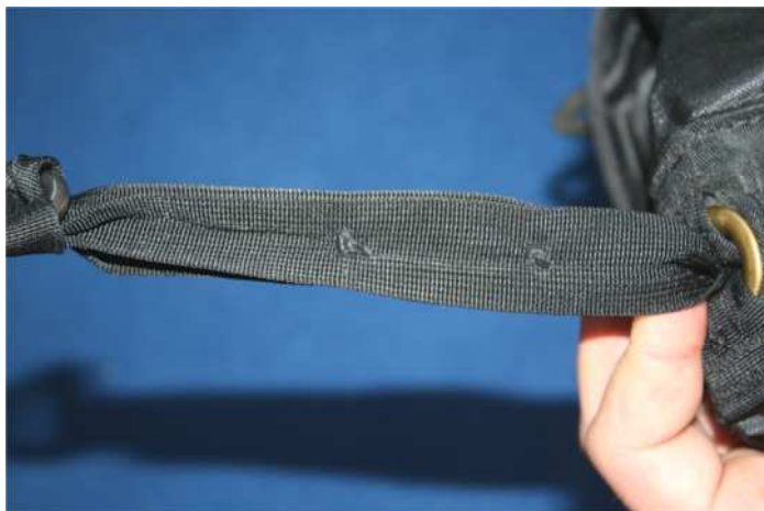
Abb.4 Beide Knoten in Position